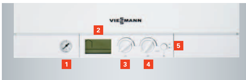
Régulation avec système de diagnostic intégré

Lors d'un soutirage, le réservoir à système de charge est alimenté en permanence en eau chaude produite par l'échangeur à plaques, d'où la disponibilité immédiate d'eau chaude à la bonne température et la stabilité de la température en cas de soutirage important. Des sondes permettent d'atteindre puis de maintenir la température pré-réglée. En cas de besoin, le brûleur MatriX cylindrique de la Vitodens 111-W s'enclenche automatiquement et veille à maintenir la température d'eau souhaitée. Ce principe est particulièrement efficace lors du remplissage d'une baignoire ou d'une douche prolongée.