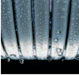
Echangeur Inox-Radial performant et d'une grande longévité

La chaudière gaz à condensation Vitodens 111-W avec ballon en acier inoxydable à système de charge intégré offre un grand confort en matière de chauffage et de production d'eau chaude.